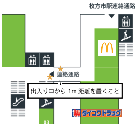
①枚方市駅連絡通路下出入口外 ※ダイコクドラッグ前は不可